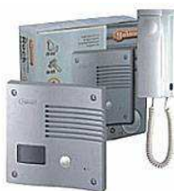
Golmar kit t.b.v. communicatie met bezoeker

De GSM-deurbel vervult twee basisbehoeften: comfort en veiligheid.